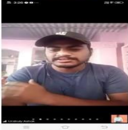
VI) Students participation.Day4