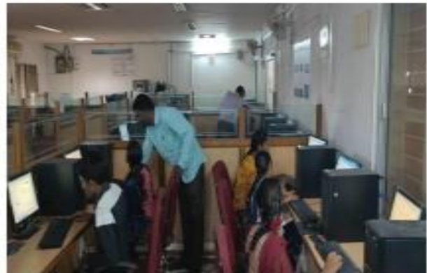
II) Students writing the Online MOOCS Exams