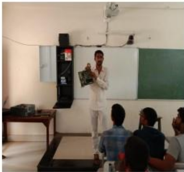
IV) Hardware training programme