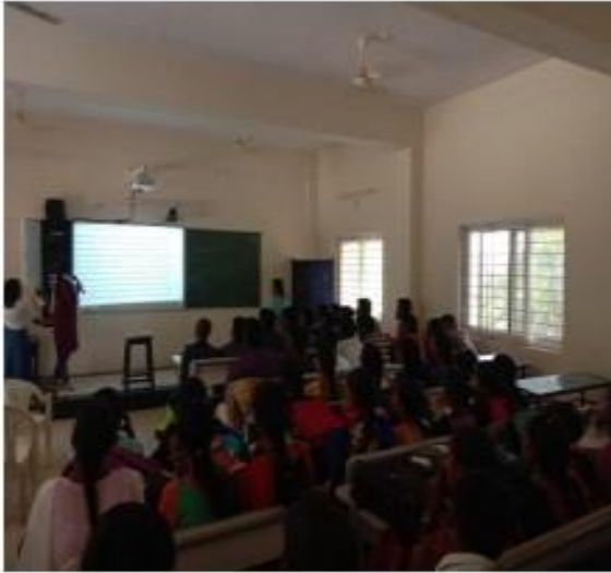
I) Speaking skills