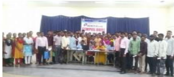
IV .Selected students.