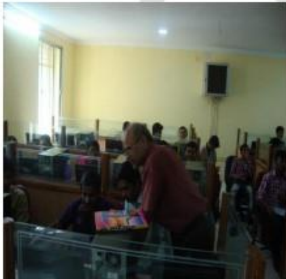
III) TRAINING PROGRAMME