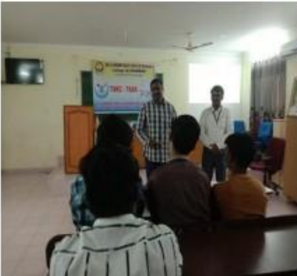
I) TSKC Coordinator inaugurate the programme

As a part of TASK Curriculum TSKC conducted 2 days training Program on “Tally” from 27-01-2020 to 30-01-2020. In this training Program trainer from TASK were trained to the students. In this training III year B.Com students TASK registered students were participated. And trainer trained the students in Tally.