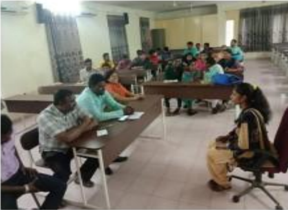
III) Mock interview