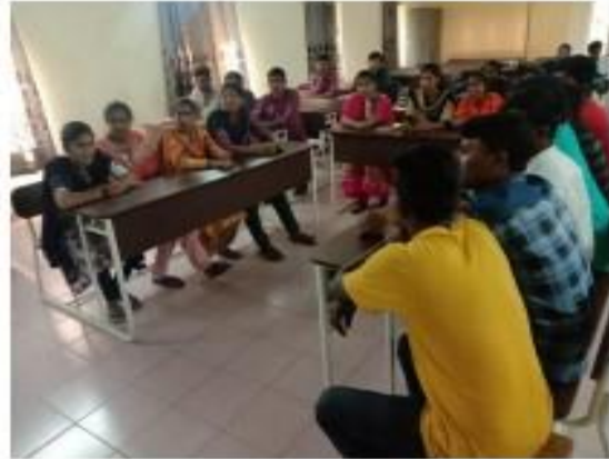
IV) Group Discussion