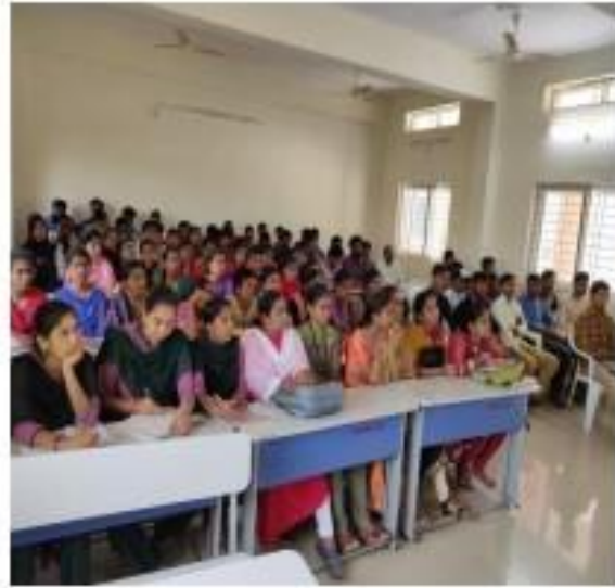
II) Students Participation in HireMee awareness