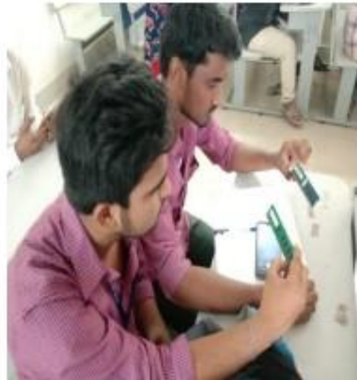
V) Students participation