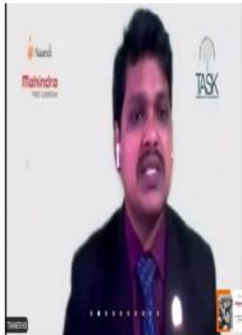
II) Trainer explain the content of the programme Schedule.