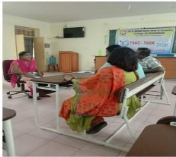
II) Mock interview