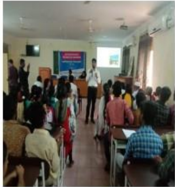
IV) Training session into B.sc Students