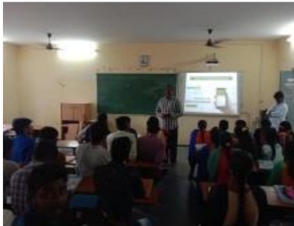
V) TSKC Coordinator - Addressing the Students