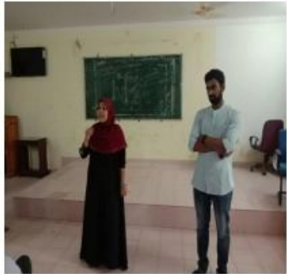
II) Students shearing their Ideas