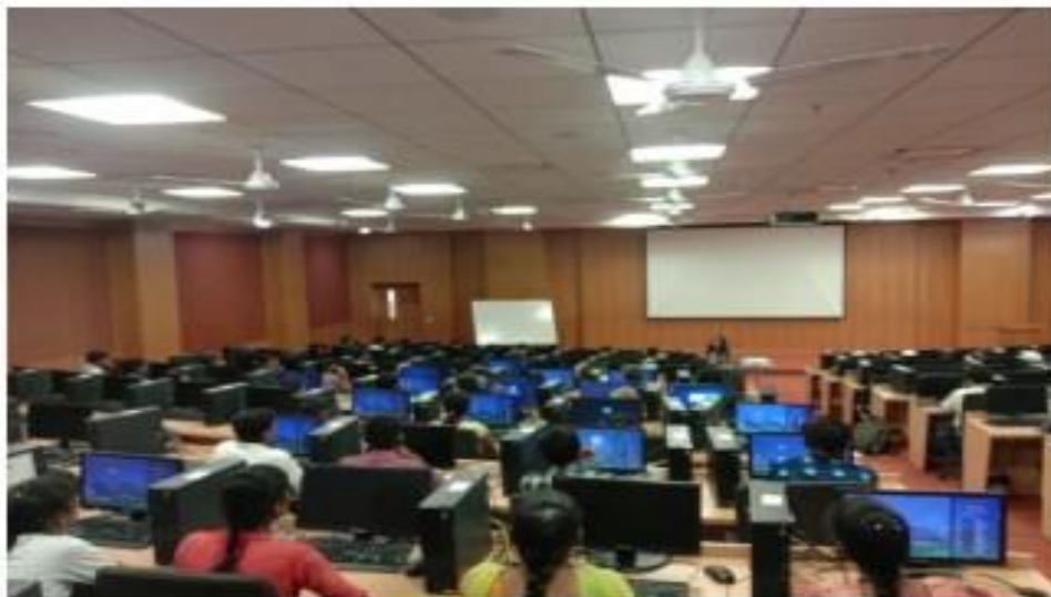
II) Students participated the session at @Infosys Software Company