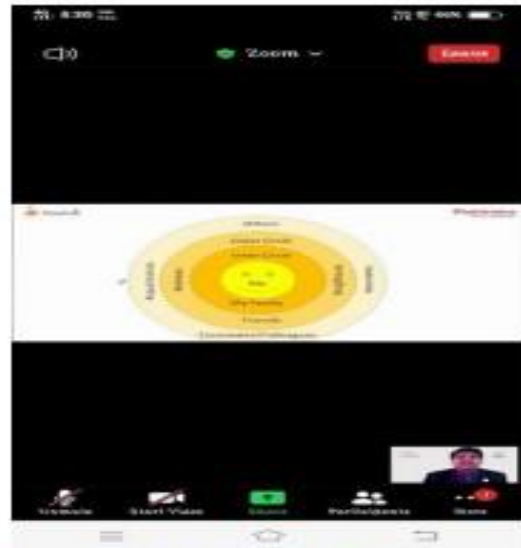
IV) Training programme Day2