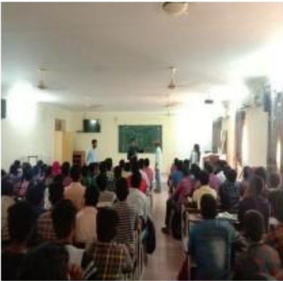
III) Students interaction with company Trainers