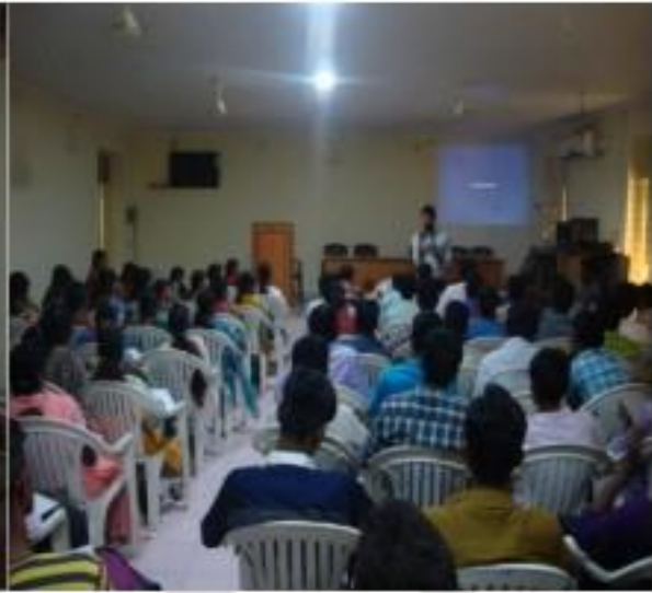
I) VICE PRINCIPAL INUGARATE THE TRAINING PROGRAMME II) TSKC COORDINATOR EXPLAIN THE PROG