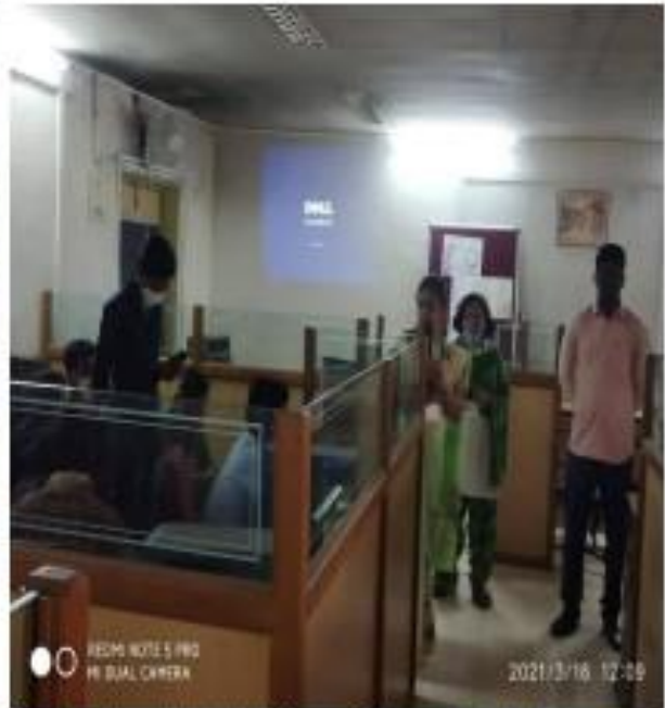
IV) Spoken Tutorial Team Observing the Exam.