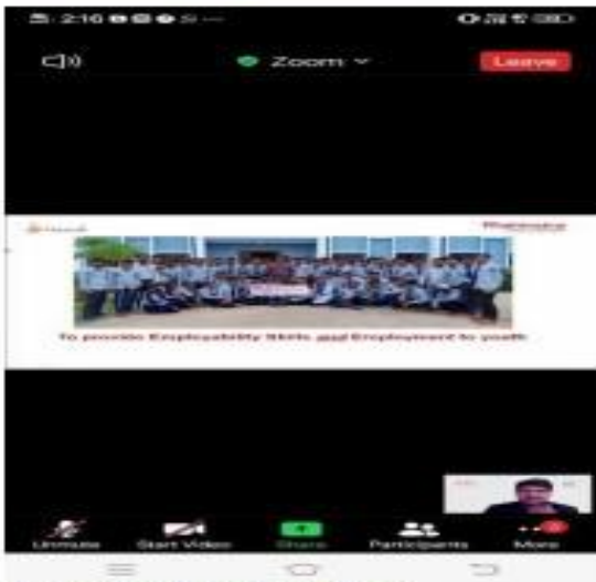
V) Training programme Day3