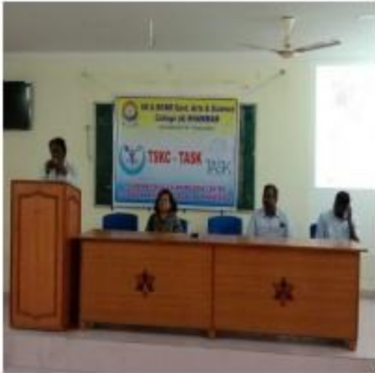
I) Principal speech about HireMee Mobile App Programme