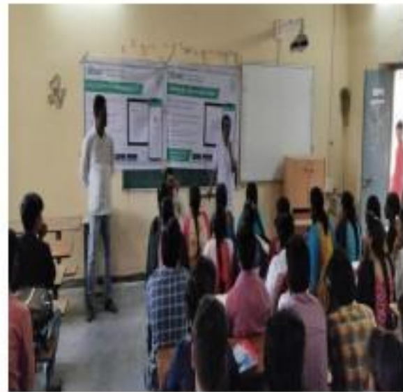
IV) Principal awareness proramme B.Com (CA) Students