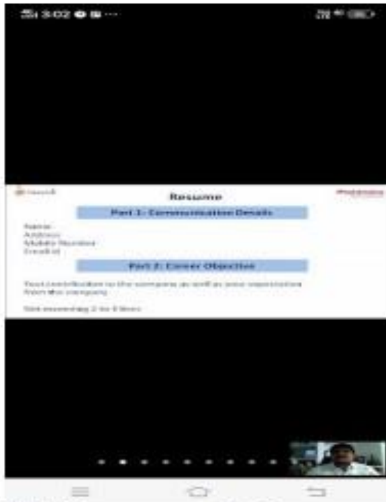
V) Training programme Day5