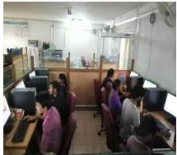
II) Students watching the Liber Office Classes