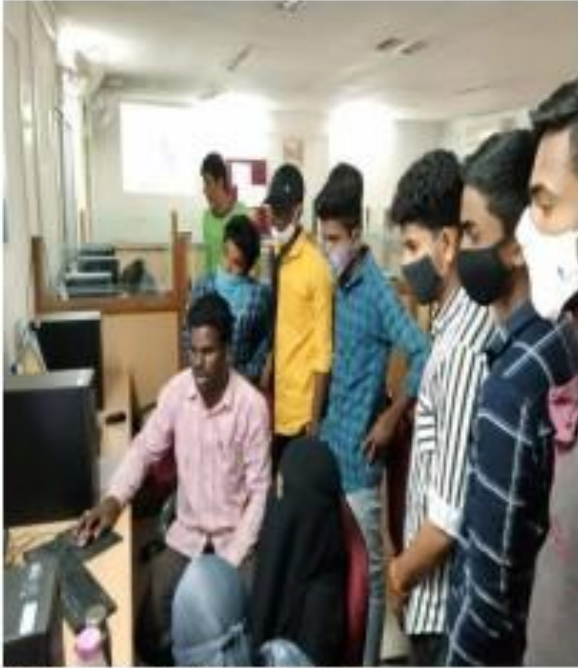
I) Spoken Tutorial Registration