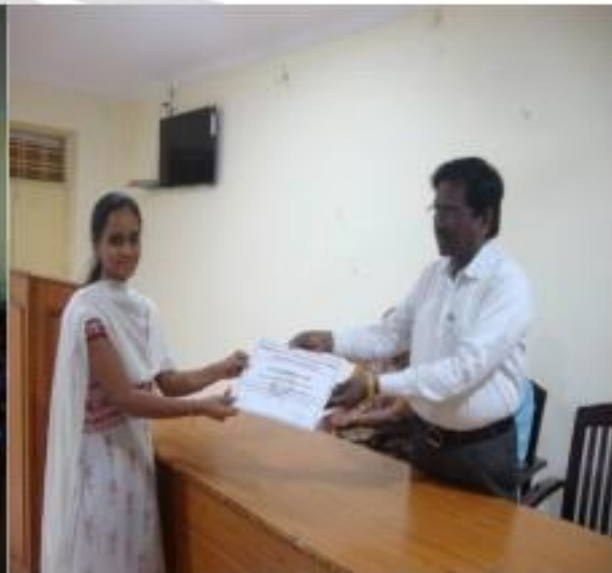
IV) CERTIFICATE DISTRIBUTION