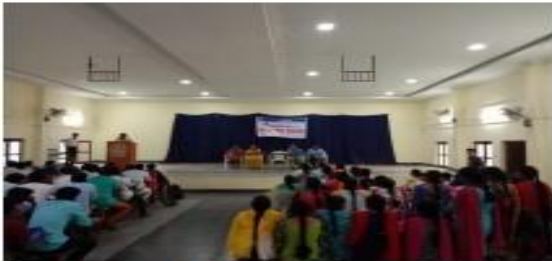
I. Principal speech about Drive