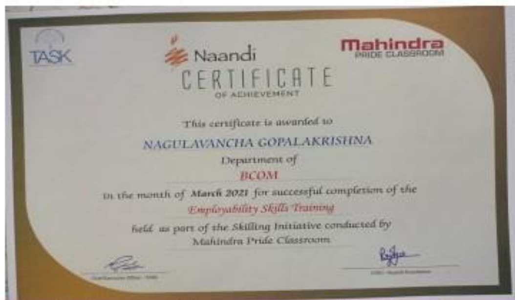
Mahindra pride classroom training programme participation certificate.