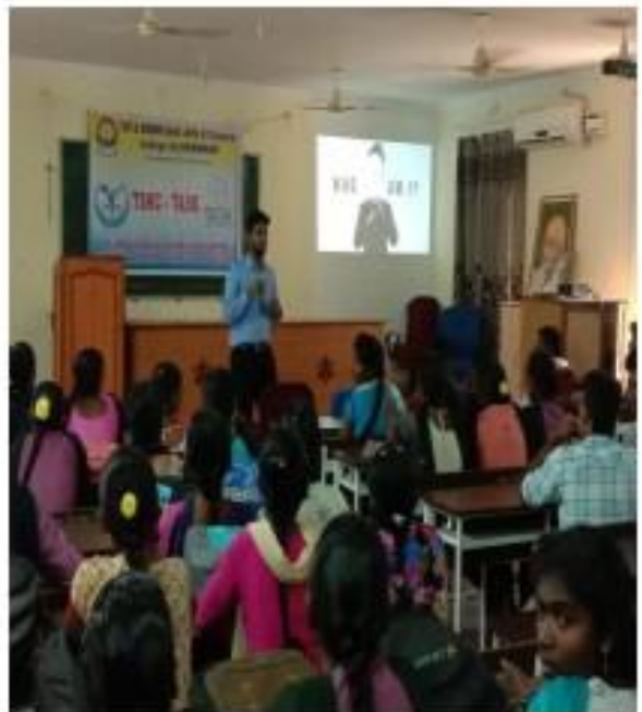
VI) Training session n in to B.Com students