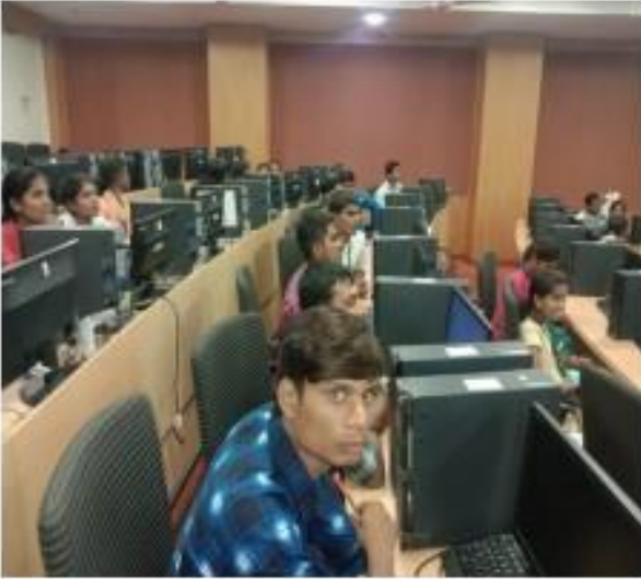
III) Students participation