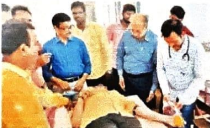
రక్తదానం చేస్తున్న విద్యార్థులు