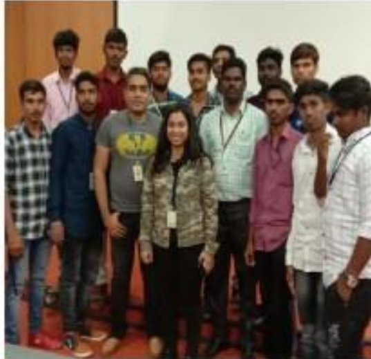
IV) with Infosys team