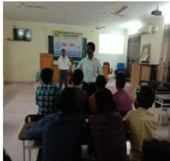
II) Incharge Principal Inauguration