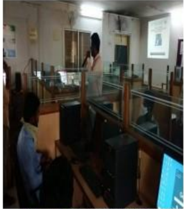
II) Students watching the Liber Office Classes