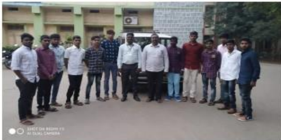
I) TSKC Coordinator with Infosys field trip visit students

TSKC organized Infosys Campus visit as a part of Industrial Visit on 12-01-2020. In this TASK registered 20 students were attended.