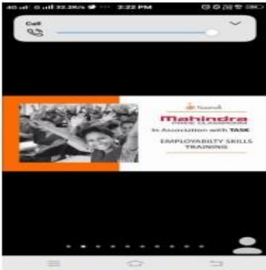
III) Training programme Day1