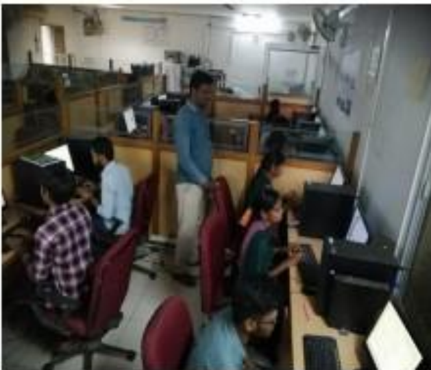
I) Spoken Tutorial Registration