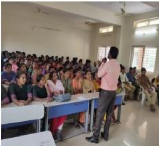
III) TSKC FTM Brief Explanation about the APP