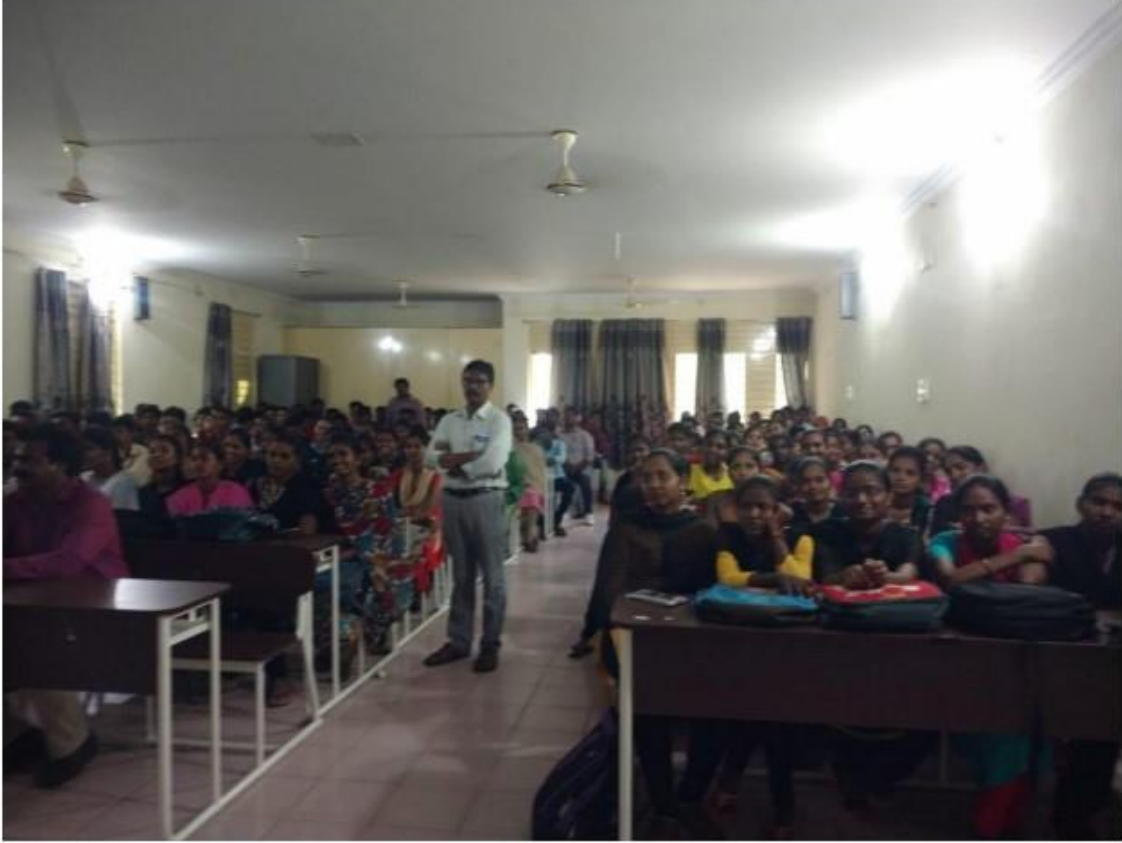
Pallipadu Friends Youth, Khammam