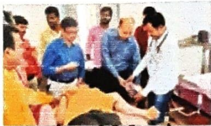
రక్తదానం చేస్తున్న ఎస్ఎస్ఎస్ వలంటీర్లు