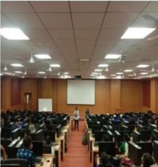
V) Students feedback