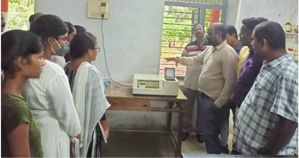
All India Radio(AIR), Kothagudem