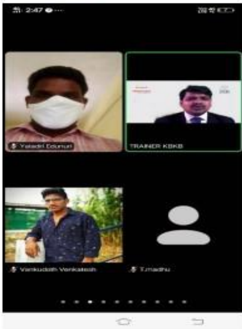
I) TSKC Coordinator inaugurate the training and Programme.

As a part of TASK Curriculum TSKC conducted 8 days training Program on “Mahindra pride Class Room Training Programme” trainer from TASK were trained to the students. Various topics like Goal Setting, Resume writing, Interview skills and GD covered and various activities conducted. In this training III year TASK registered students were participated.