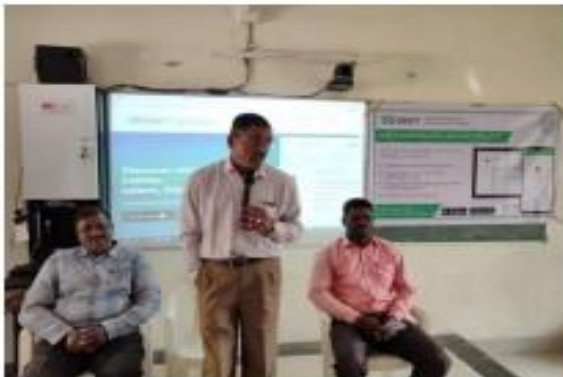
I) Principal Speech about DEET