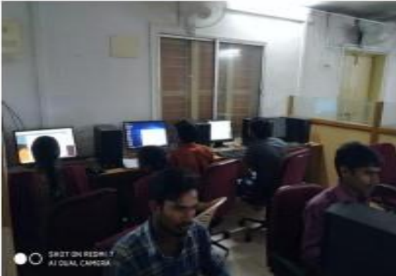
I) MOOCS Online Exam

TSKC conducted IIT Bombay Spoken Tutorial online examination from 20-02-2020 to 13-03-2020 to spoken tutorial registered students. Total 567 students were registered in IIT Bombay spoken tutorial in various courses like Biopython, Libre office, Frontaccounting, C,C++, Java etc. 192 students got Certificates.