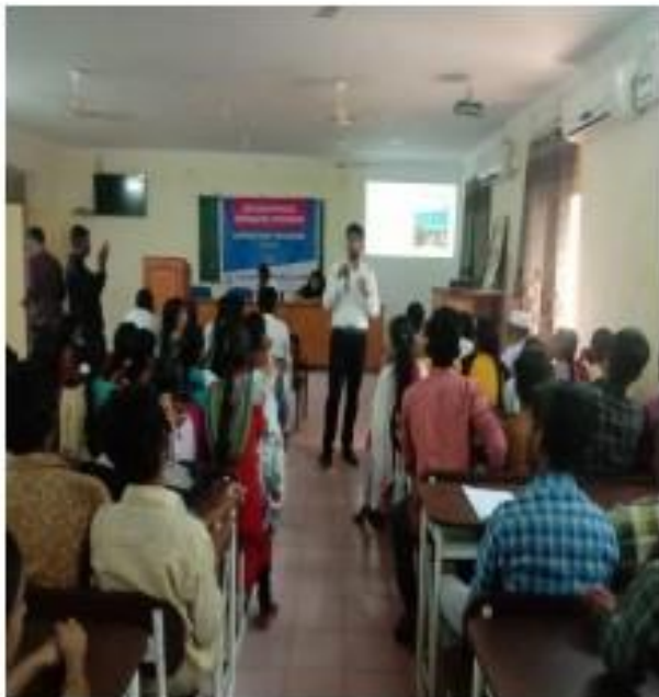
V) Trainer training the students