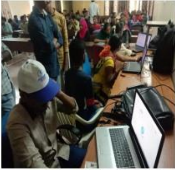
III) Registration process