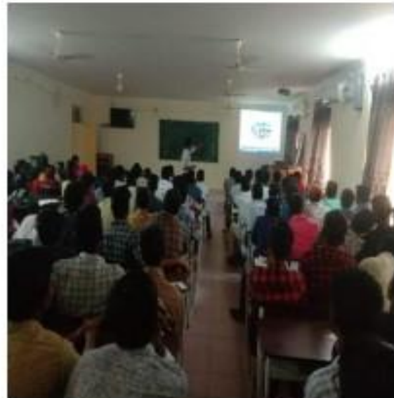
II) Briefing about the training session