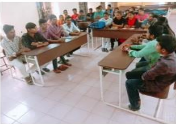
V) Group Discussion