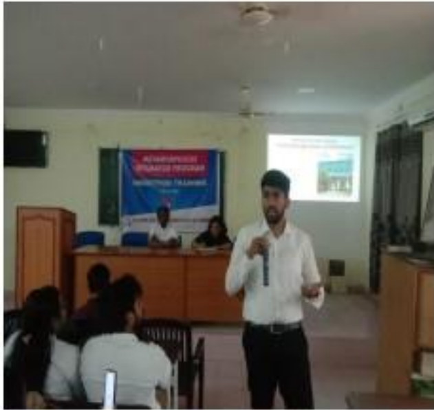
III) Trainer explain the Training Schedules