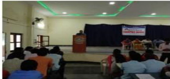
II. Employment officer speech about Drive