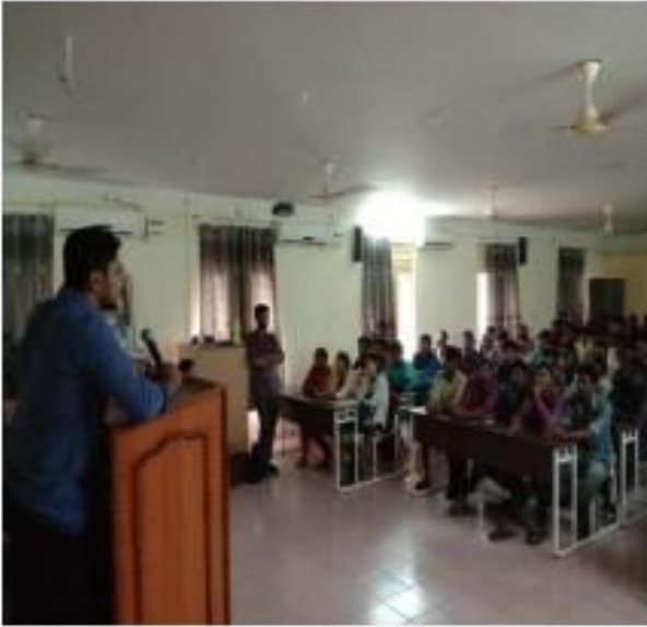
I) Training session