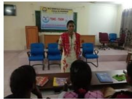
VI) JAM Session