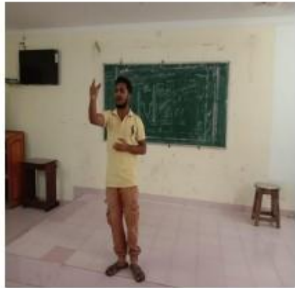
IV) Students participation